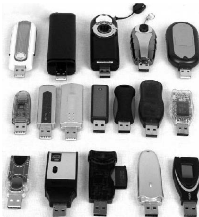
Exemplos de pendrives.