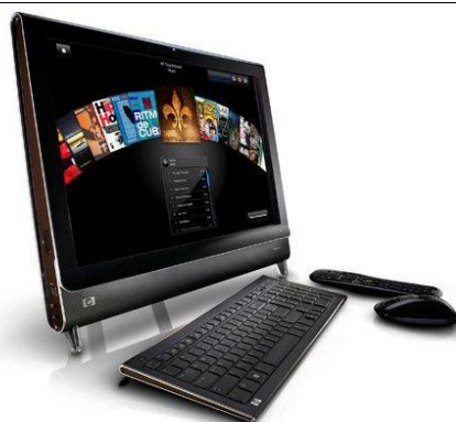
All-in-one com teclado, mouse e controle remoto.