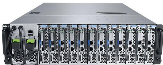
Servidor em rack. Fonte: Dell.