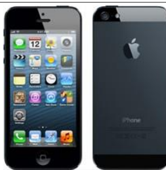
Smartphone. Fonte: Apple.