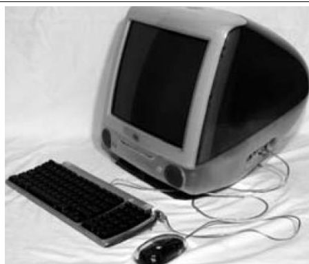
Apple iMac, teclado e mouse.