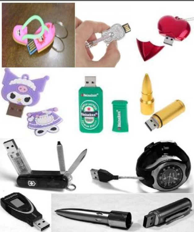
Exemplos de pendrives "camuflados".