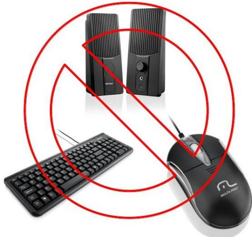
Periféricos. Fonte: Multilaser.