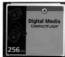
Compact flash card