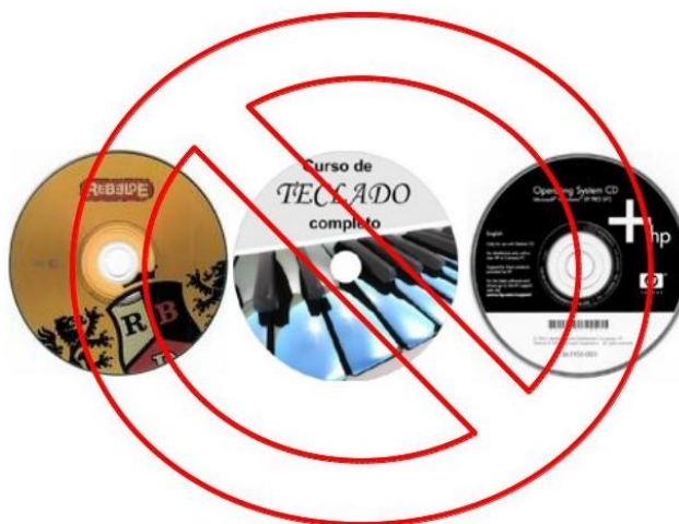
Mídia óptica industrial.