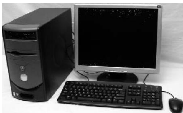
Desktop com monitor, teclado e mouse.

Equipamentos computacionais podem tomar várias formas, como portáteis (laptop, notebook, netbook, ultrabook, booktop, wearable, tablet, PDAs, smartphones), desktops (torre, mini-torre, dockstation), servidores (racks, torres, main-frames), all-in-one (tudo em um), smart tv.